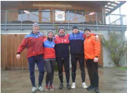
Vor dem nagelneuen Bootshaus des RV Eltville

Weitere Eierfahrer reisten aber mit dem Auto zum RV Eltville 1919 e.V., wodurch die Teilnehmerzahl des RVI in der Summe wieder stimmte. Die Freunde der Binger RG gaben dagegen gleich ganz auf.