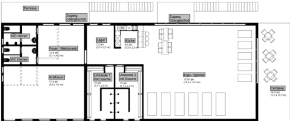
Eine von vier Varianten: die „XL“-Umsetzung für das Obergeschoss

bereits: Die Agenda 2025 hat der Vorstand formuliert. Sie soll in der kommenden Mitgliederversammlung als Grundlage der Diskussion dienen, wo wir als Verein hinwollen (könnten).