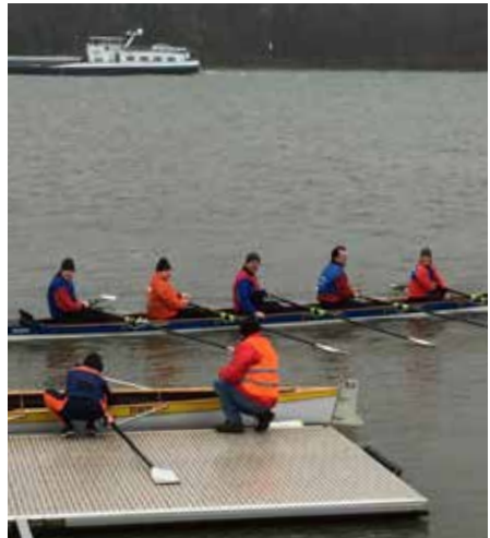
Anlegen in Eltville

Die Ruderer wählten den Fünfer, das Boot war somit auch gut beladen und verfügte über bemerkenswerten Tiefgang. Aber der Wind blieb im Bereich leichte Brise aus West und die Ruderarbeit konnte gut absolviert werden.