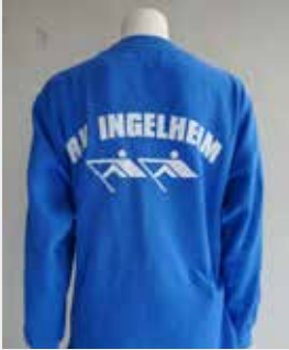
Ruderhosen & Sweatshirts