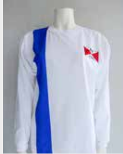
Trikots & T-Shirts