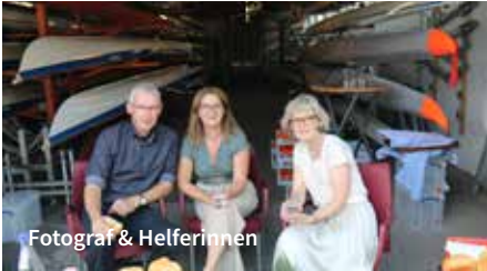
Fotograf & Helferinnen