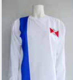
Trikots & T-Shirts