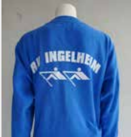
Ruderhosen & Sweatshirts